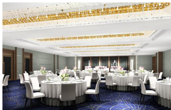
改装イメージ 3 階 中宴会場「天平」(左)、「飛鳥」(右)

◇中宴会場「天平（てんぴょう）」 広さ 380㎡ 着席定員 180名 立食定員 250名