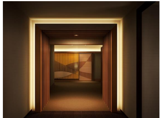
改装イメージ 3階特別個室「高砂」(上段) エントランス(左下) 廊下(右下)