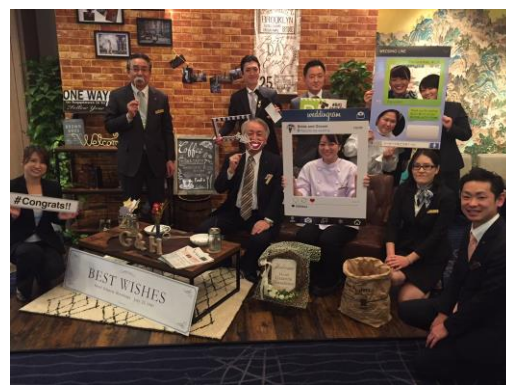
2018 フォトスポットプロジェクトメンバー