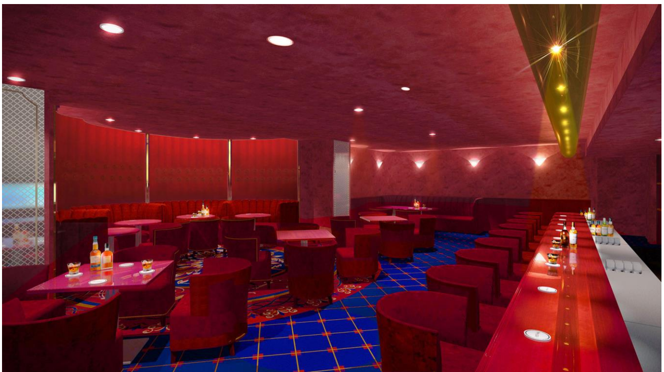
メンバー「メイフラワー」内観イメージパース