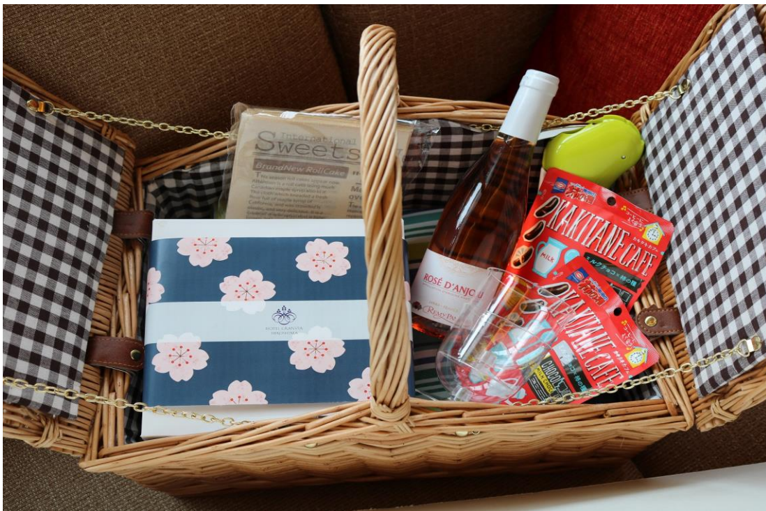
「おでかけピクニックセット」

国内外の観光客にこのピクニックセットとホテルをご用意するおすすめマップを持って広島のおでかけスポットに出かけていただき、広島の魅力を再発見するきっかけになればと考えています。詳細は以下の通りです。