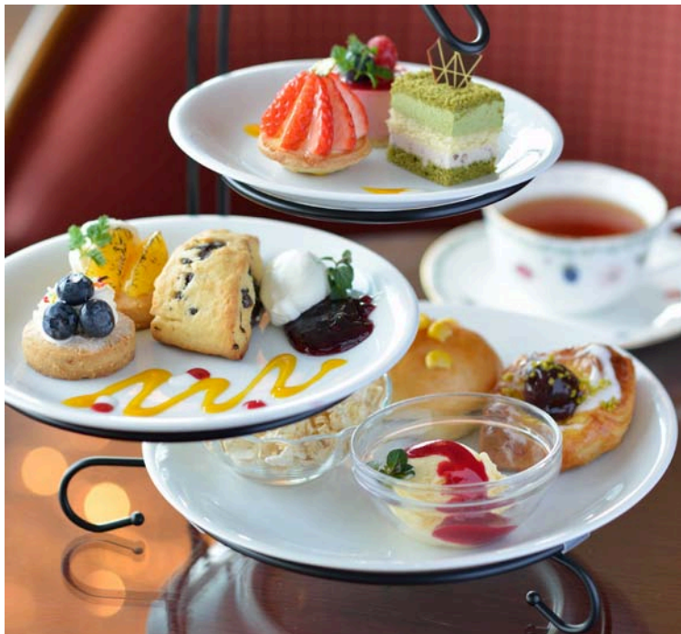
(写真左)ロビーラウンジの「アフタヌーンティーセット」

ホテルグランヴィア広島(広島市南区松原町1-5、代表取締役社長 湊 和則)は、今年4月に全国菓子大博覧会・広島(ひろしま菓子博 2013)の開催を盛り上げる為、3月1日(金)からひろしま菓子博 2013 最終日にあたる5月12日(日)まで、初の試みとして全館で「春のスイーツフェア」を開催いたします。