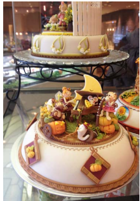
(写真右)マジパンデコレーション展示の様子

地元企業として、昨年秋には紅葉の工芸菓子を1階ロビーにて展示、現在は2階カフェ&ブッフエレストラン「ヴァンヴェール」店頭にて、「マジパンデコレーション」を展示しています。また県外客に向けて「ひろしま菓子博 2013」入場引換券と市内路面電車一日乗車券がついた宿泊プランもリーズナブルな価格で販売し、認知向上に努めています。今回の「春のスイーツフェア」で、更に「ひろしま菓子博 2013」の開催を盛り上げていきたいと考えています。詳細は以下の通りです。