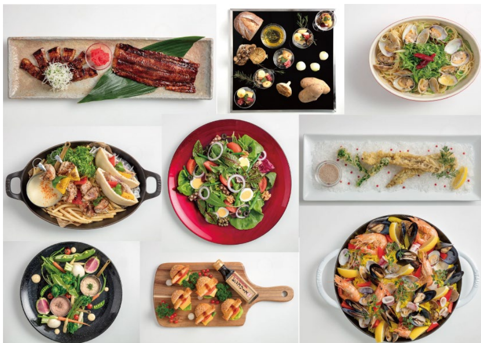
瀬戸内×地中海フェア〈イメージ画像〉

また、このフェアを通じて、地元広島の方や観光客に対し、瀬戸内食材の魅力の認知拡大を図ってまいります。