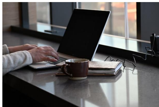
駅直上の特別な穴場空間イメージ

カフェやバータイムには、UmiShima Dining オリジナルブレンドコーヒーや自然農法の瀬戸田レモンを使用したオリジナルレモネードをはじめ、多彩なカフェメニューやアルコールをご用意。JR広島駅直上という便利なアクセスで席数も多く、新幹線の待ち時間やお買い物の休憩時間などにご利用いただけます。また、Wi-Fi設備に加えて、窓に面した明るく開放的なカウンター席には充電用のコンセントやUSBの差し込み口も完備。新しい駅ビルの中でもリラックスできる「穴場なカフェ&バー」としてご利用ください。