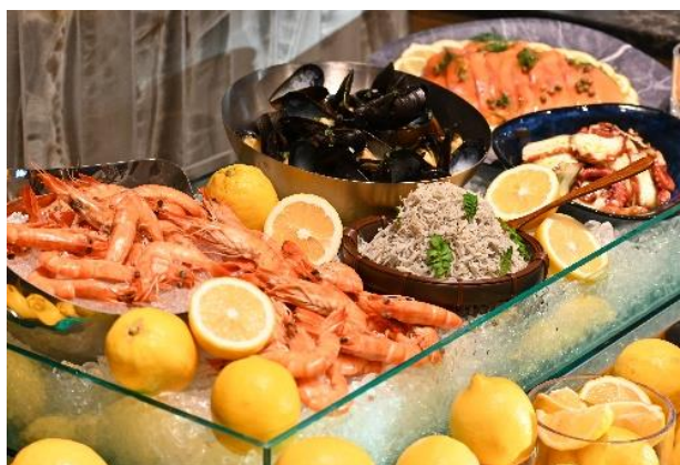
「海と島」の豊かな恵みを感じるシーフードマルシェ

【価格】 大人 4,700円 / 6-12歳 2,300円 / 3-5歳 1,000円