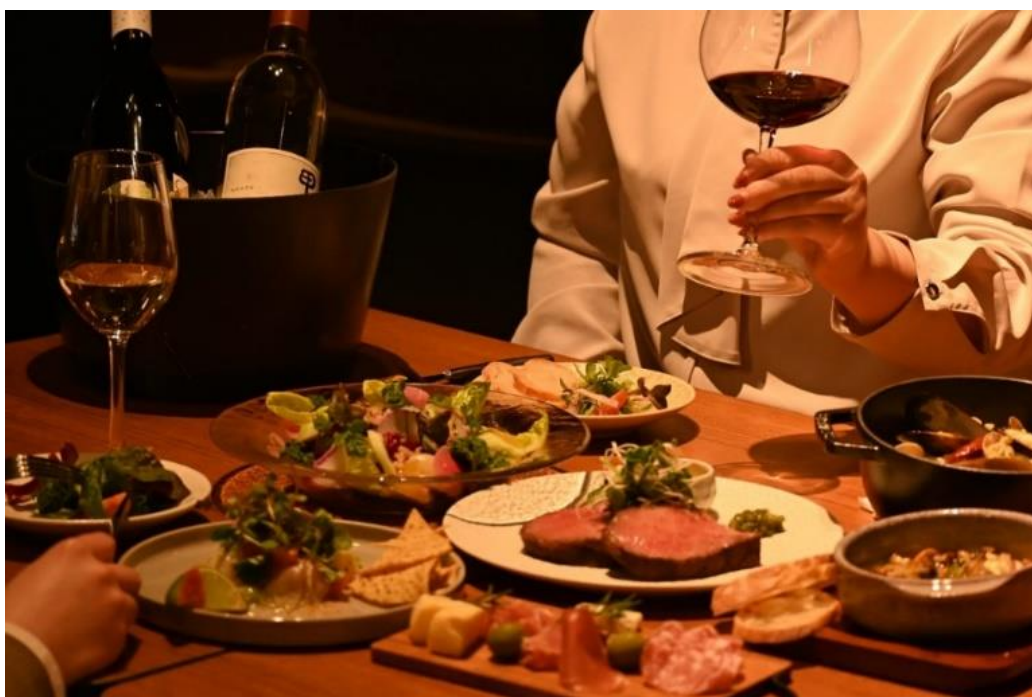
ワインと楽しむスパニッシュイタリアンバルイメージ

【価格(一例)】 料理 香川県産オリーブ豚 肩ロースのシャルキティエール 1,800円 クリーミーな鱈のブランダード グリエチーズ焼き 1,300円 ゴルゴンゾーラと胡椒のクリームソース・ジャガイモのニョッキ 2,000円 ドリンク グラスワイン 800円～