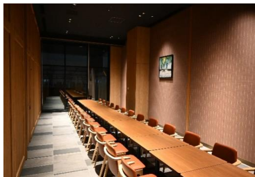
グループ利用におすすめ 個室イメージ