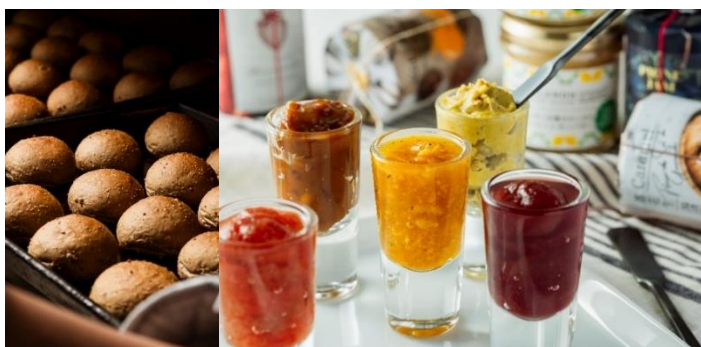
焼きたてのパン (左) 広島県産の果物を使った無添加のコンフィチュール (右)