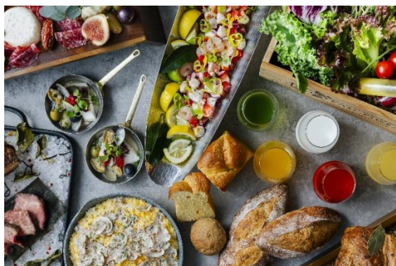
美味しさとカラダに優しい食材を自由に楽しむ シェフのセレクトランチブッフェイメージ

【価格】 平日: 大人 3,300円 / 6-12歳 1,600円 / 3-5歳 1,000円 土日祝: 大人 3,900円 / 6-12歳 1,900円 / 3-5歳 1,000円