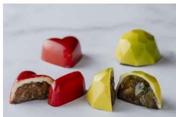
(左)ライムショコラ (右)レモンショコラ

【予約方法】公式HP https://www.hgh.co.jp/rest/takeout/plan/002610.html