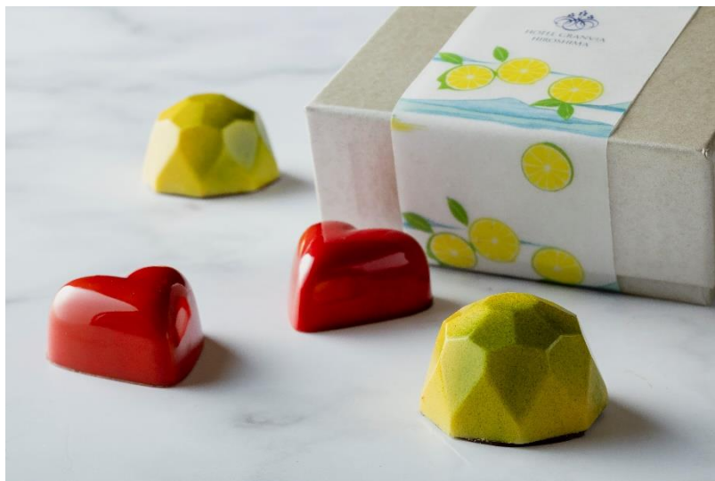
「せとうち贅沢ショコラ」お渡しイメージ