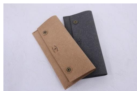
「八橋装院」ファクトリーブラン